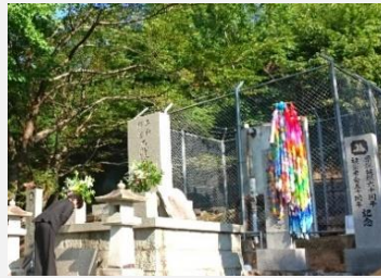
原爆被爆者会津山支部 祈念式