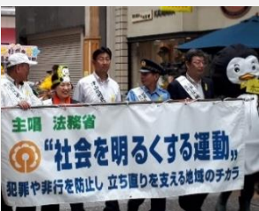
社会を明るくする運動