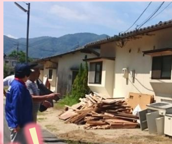
和気町営住宅 浸水被害