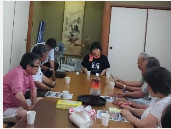
平山コミュニティハウス (赤磐市)