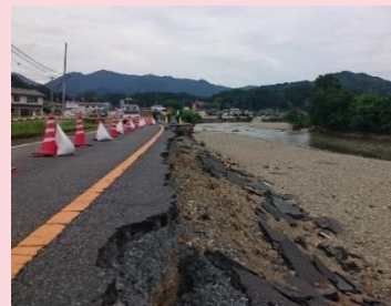
真庭市県道313号線水害 道路崩落