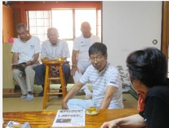
ミニ集会 (備前市頭島)