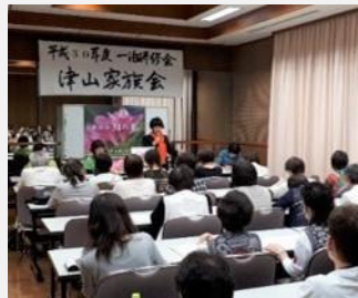
津山断酒新生会 一泊研修会