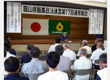
岡山県酪農政治連盟通常総会