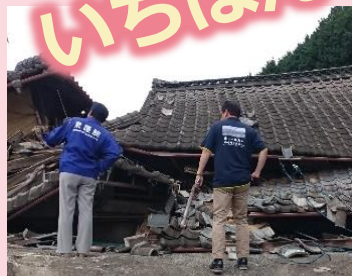
津山市久米地区 家屋全壊被害