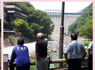
真庭市湯原蒜山 被災地視察