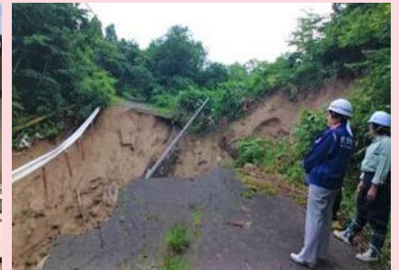
津山市阿波地区 林道被害視察