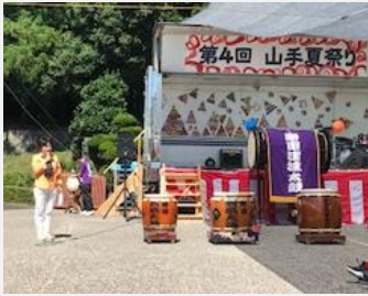
山手夏祭り (久米南町)

政務の合間や週末には、可能な限り地元岡山3区に戻り、街頭での国政報告、ミニ集会や行事への参加を通じて、地元のみなさまの声を聴かせていただいております。目印はよく身につけているオレンジです。気軽にお声がけください。被災された方々の一日も早い復興を心から願い、みなさまのくらしのために全力で働いてまいります！