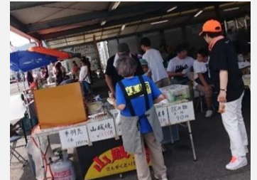
伊里漁港日曜日 真魚市 (備前市)