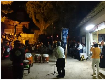
両山寺 二上山護法祭 (美咲町)