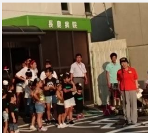
長島病院 天撰会夏祭り (東区瀬戸町)