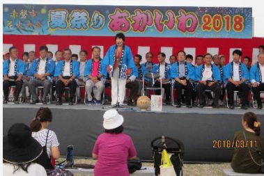
あかいは夏祭り (赤磐市)