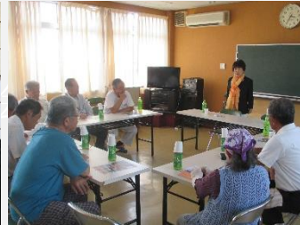
ミニ集会 (東区森末コミュニティハウス)