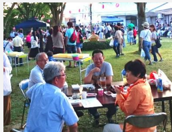
真庭市蒜山 千寿荘夏祭り