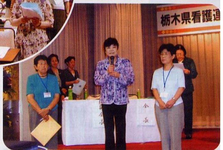
20年度 総会風景 平成20年6月21日 於: コンセーレ