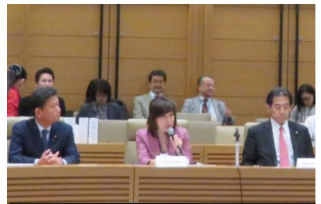
平和な社会で、全ての子どもに教育と健康を