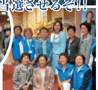
21年度 通常総会風景